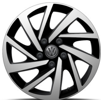
Cerchio in lega in Nero WOODSTOCK 18"