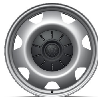
Serie per Beach Tour e Beach Camper con motori F* e H* ; Ocean con motori F5-F9-H* Cerchi in acciaio 17"