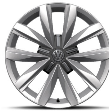
Cerchio in lega in Argento SPRINGFIELD 18"