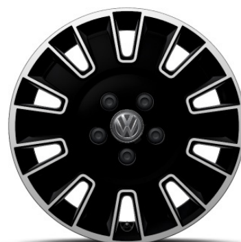
Cerchio in lega in Nero POSADA 17"