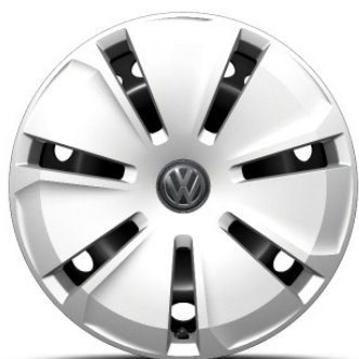
Serie per Beach Tour e Camper con motore E2 Ocean con motore E2 e F7 Cerchio in acciaio 16"