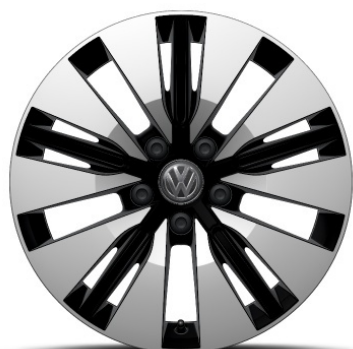
Cerchio in lega in Nero TERESINA 18"