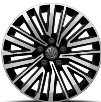
Serie per tutte le versioni Edition Cerchio in lega in Nero PALMERSTONE 18"