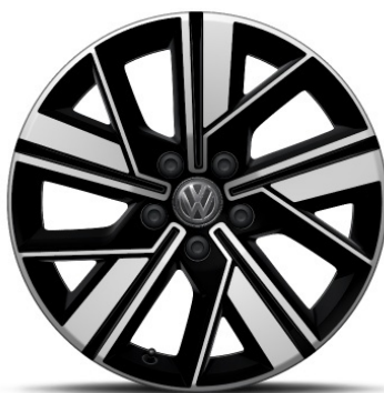
Cerchio in lega in Nero VALDIVIA 18"