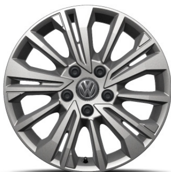
Cerchio in lega ARACAJU 17"