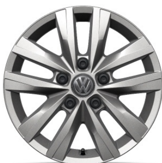
Cerchi in lega CLAYTON 16"