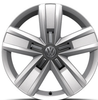
Cerchio in lega in Argento DEVONPORT 17"